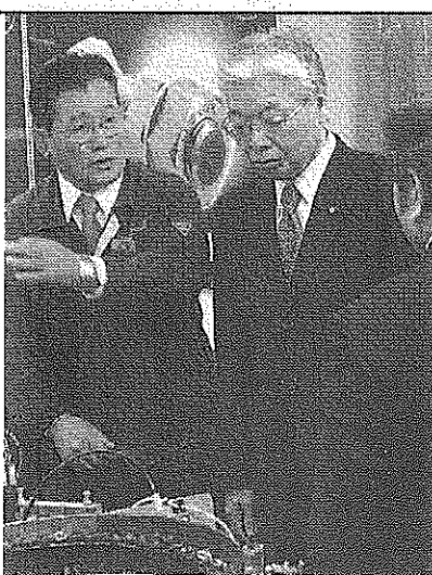
工場を視察する直嶋正行経済産業相(中央)＝大阪府東大阪市のハードロック工業

13日午前、ベトナム航空による関西―ハノイ線の新規就航式典が関西の旅客ターミナルで開かれた。 アジアや米国など海外の航空会社が関西空港に新規に就航したり、増便したりするケースが昨秋から増えている。関西国際空港会社が昨年、着陸料の大幅な割引制度を導入したことや、日本航空の撤退で一部の路線では需要を確保できる見通しがたつたことが原因のようだ。 13日午前、ベトナム航空による関西―ハノイ線の新規就航式典が関西の旅客ターミナルで開かれた。