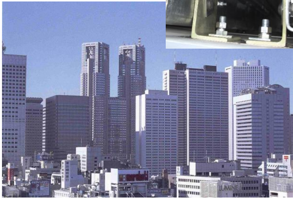
高層ビル外壁・カーテンウォール