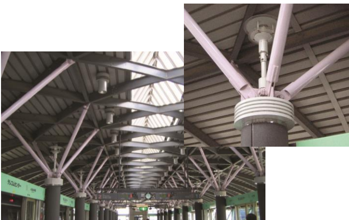
新交通 ゆりかもめ駅舎屋根